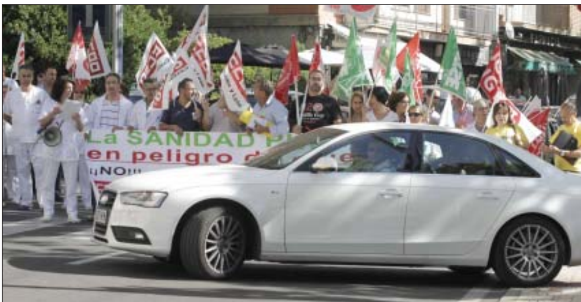
Imagen de la concentración de trabajadores sanitarios frente al Hospital Virgen de la Vega.

La mora de los EFC -que conceden sobre todo financiación para comprar automóviles, muebles, televisores y otros bienes de consumo- se elevó de nuevo, hasta el 8,97 por ciento, después de tres meses consecutivos en el 4,62 por ciento.